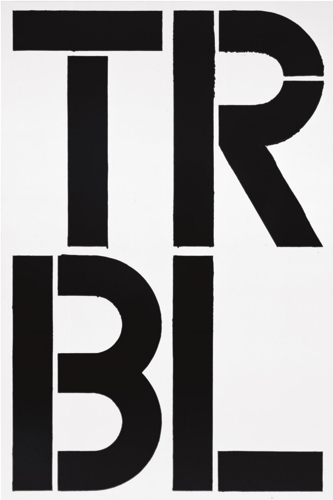
Christopher Wool, Trouble , 1989, The Guggenheim Museums and Foundation 1